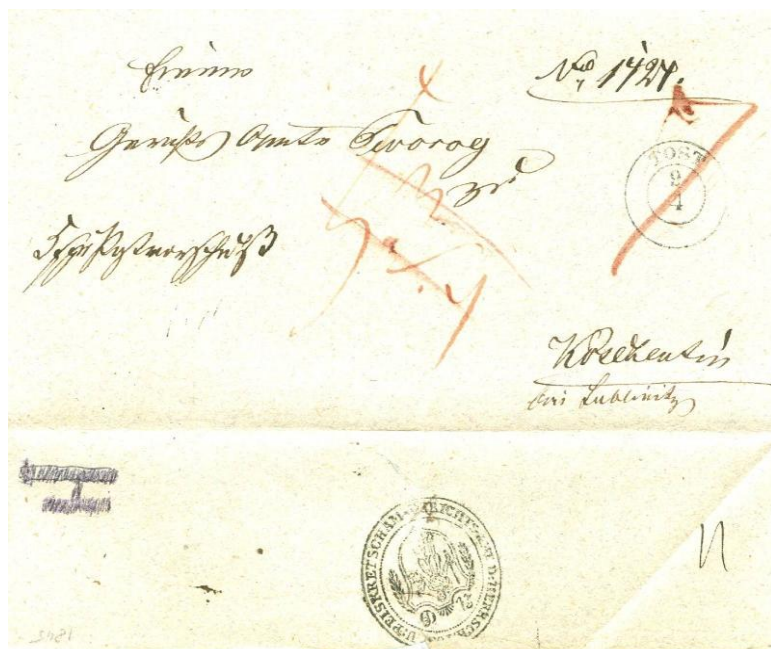
List windykacyjny nadany w 1878 r. w Tost /Toszek/ do Kreulentin. Stempel dwu obrączkowy. List pieniężny, wartość długu 5 srebrnych fenigów. Sucha pieczęć miasta Peiskretscham /Pyskowice/.