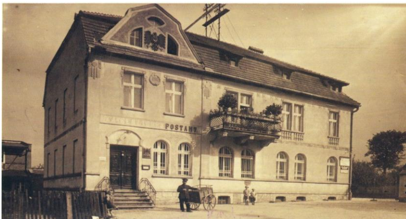
Budynek Urzędu Pocztowego w Toszku /Tost/

Prawa miejskie Toszek otrzymał około roku 1235. W 1281 r. książę Władysław podzielił Górną Śląsk pomiędzy czterech synów tworząc Księstwo kozielsko-bytomskie (1281-1355). W tym czasie Toszek był siedzibą księżęcą o czym świadczył tytuł jakim określano księcia - "jaśnie oświecony Bolesław, książę Toszka". Już w 1346 r. władzę w mieście sprawował burmistrz z Radą Miejską. W okresie swojej świetności Toszek posiadał mennicę bijącą brakteaty, kwartniki i grosze z herbem miasta, papiernię, hutę szkła, browar, gorzelnię, młyny oraz wyłaczarnię oleju. Po śmierci ostatniego księcia kozielsko-bytomskiego, książę Konrad Oleśnicki zhołdował Toszek (1356), a rok później ziemia toszecka przeszła do Księstwa Cieszyńskiego. W XVI wieku pierwotny gród piastowski przeszedł na własność Habsburgów, a później pozostawał w rękach prywatnych.